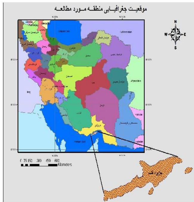
شکل شماره ۲: نقشه موقعیت جزیره قشم در استان هرمزگان را نشان می دهد.

جزیره قشم، بزرگترین جزیره تنگه هرمز و خلیج فارس و از پرجمعیت ترین جزایر ایران است. زمانی این جزیره از رونق و شکوفایی برخوردار بوده است. شهر قشم در شرقی ترین نقطه جزیره واقع است. بندر لافت در وسط جزیره و بندر باسعید در منتهی الیه غرب جزیره قرار دارد، این جزیره دارای ۷۵ روستا است. طول جزیره قشم حدود ۱۱۵ کیلومتر است در حالی که عرض جزیره متفاوت است تاجایی که عرض جزیره در شهر قشم حدود ۵ کیلومتر و در قسمت باسعید حدود ۱۱ کیلومتر و در بندر لافت حدود ۳۱ کیلومتر است. کل مساحت جزیره ۱۰۹۳ کیلومتر مربع و طول سواحل جزیره قشم برابر ۲۷۵ کیلومتر می باشد. این جزیره دارای اسامی مختلف بوده است، قبل از اسلام انرا برخت می خواندند. بعدها نام لافت را بران نهادن (که اکنون یکی از بنادر شمالی آن است) و سپس قشم که یکی از بنادر آن بود خوانده شد که امروزه به همین نام مشهور است. جمعیت جزیره در سال ۱۳۱۰ حدود ۱۵۰۰۰ نفر بوده و در سال ۱۳۵۵ برابر ۲۹۳۹۸ نفر بوده است. جمعیت آن طبق سرشماری ۱۳۶۵ به ۵۲۰۴۷ نفر رسیده است، و در سال ۸۸ تعداد جمعیت بوده ۸۴۶ ۱۱۳ است از معادن بسیاری برخوردار است از جمله معدن نمک، معدن گوگرد، نفت سیاه..... (الهی، ۱۳۸۴: ۴۱).