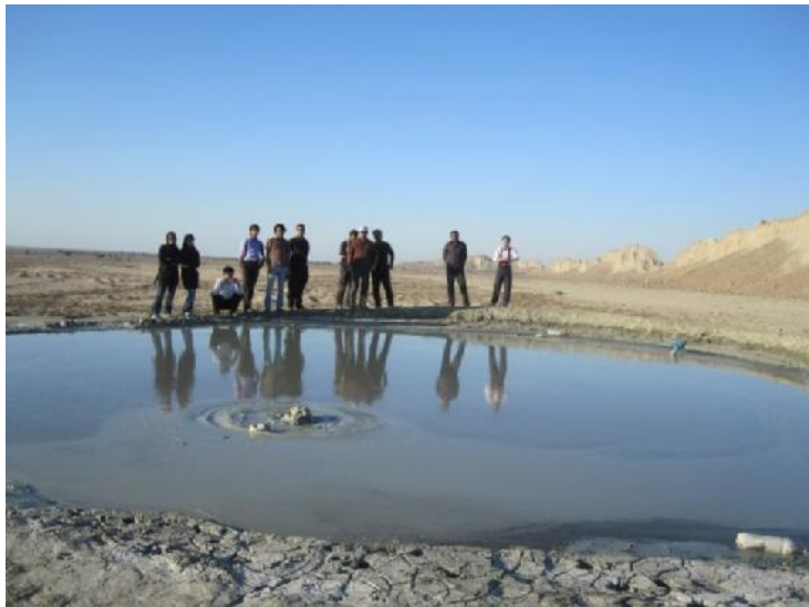
شکل ۶. گل فشان های سواحل دریای مکران

- گل فشان ها، عارضه ای طبیعی ناشی از خروج آب های زیرزمینی به صورت توده ای گلی است (علایی طالقانی، ۱۳۸۳: ۵۸). مناطق عمده ای این اشکال در استان هرمزگان بین میناب و جاسک و در سواحل دریای مکران قرار دارد (همان: ۳۷۲). گل فشان ها عموماً در دو دسته ای اصلی گرم یا آتشفشانی و سرد یا تکتونیک طبقه بندی می شود. از مهم ترین کاربردهای گل فشان ها می توان به شکل و مورفولوژی، نحوه فعالیت و خروج گل، اهمیت گل درمانی، اهمیت در تشکیل اکوسیستم های کوچک گیاهی و جانوری، همبستگی با منابع نفت و گاز و کاربردهای کوزه گری به ویژه برای بومیان اشاره کرد (نگارش و دیگران، ۱۳۸۸: ۹۴).