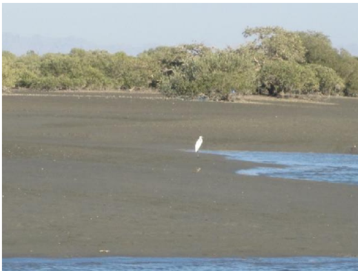
شکل ۶. تالاب های جزر ومدی در میناب در شرق تگه هرمز