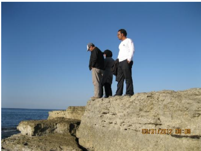
شکل ۴. سواحل بالا آمده در بندر جاسک در ساحل دریای مکران

- سواحل بالا آمده ، در ایران از حدود ۳۰ تا ۵۰ هزار سال پیش به تدریج شروع به بالا آمدن کرده اند و میزان بالا آمدگی آنها در هر سال ۱ تا ۳ میلی متر برآورد شده است. این سواحل در ایران از حوالی بندر جاسک تا خلیج گواتر با مناظر کم نظیر و منحصر به فرد قابل مشاهده است. به طور کلی از غرب به شرق بر مقدار بالا آمدگی این سواحل افزوده شده است. به طوری که از بندر جاسک حدود ۱ متر و در حوالی بندر چابهار به بیش از ۱۰۰ متر و در بندر کراچی پاکستان به حدود ۵۰۰ متر می رسد (نگارش، ۱۳۸۵: ۹۰). سازند اصلی این اشکال به ویژه در بندر جاسک کنگلومرا و بقایای صدف های دریایی و متعلق به دوره ی پلیوکواترن است (نوحه گر و یمانی، ۱۳۸۵: ۱۴۱).