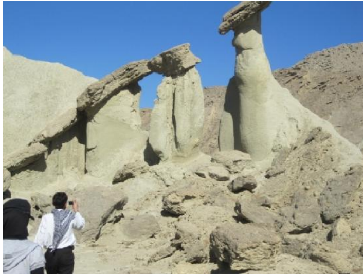
شکل ۵. اشکال قارچی شکل ناشی از فرسایش بادی در حد فاصل جاسک- میناب

- گل فشان ها، عارضه ای طبیعی ناشی از خروج آب های زیرزمینی به صورت توده ای گلی است (علایی طالقانی، ۱۳۸۳: ۵۸). مناطق عمده ای این اشکال در استان هرمزگان بین میناب و جاسک و در سواحل دریای مکران قرار دارد (همان: ۳۷۲). گل فشان ها عموماً در دو دسته ای اصلی گرم یا آتشفشانی و سرد یا تکتونیک طبقه بندی می شود. از مهم ترین کاربردهای گل فشان ها می توان به شکل و مورفولوژی، نحوه فعالیت و خروج گل، اهمیت گل درمانی، اهمیت در تشکیل اکوسیستم های کوچک گیاهی و جانوری، همبستگی با منابع نفت و گاز و کاربردهای کوزه گری به ویژه برای بومیان اشاره کرد (نگارش و دیگران، ۱۳۸۸: ۹۴).