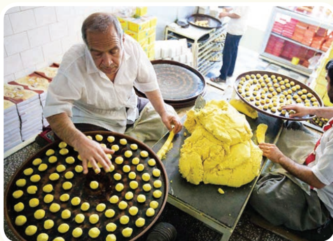
تهیه و بخت نان برنجی